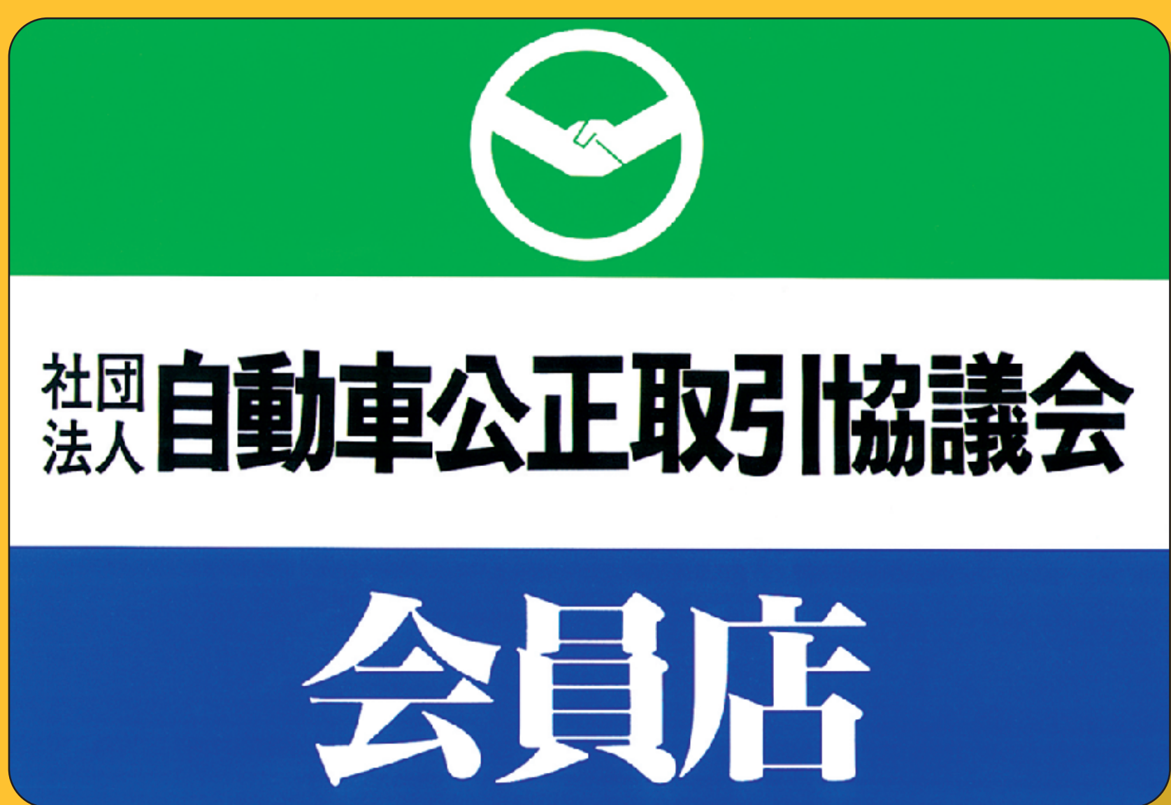
・ステッカー(四輪)

クルマ・バイク販売には、定められたルール(公正競争規約)があります。自動車公正取引協議会の会員店は、このルールに基づき安心と信頼のクルマ・バイク販売を行っています。新車も中古車も、クルマ・バイクはこの会員証・ステッカーのある会員店でお願いします。