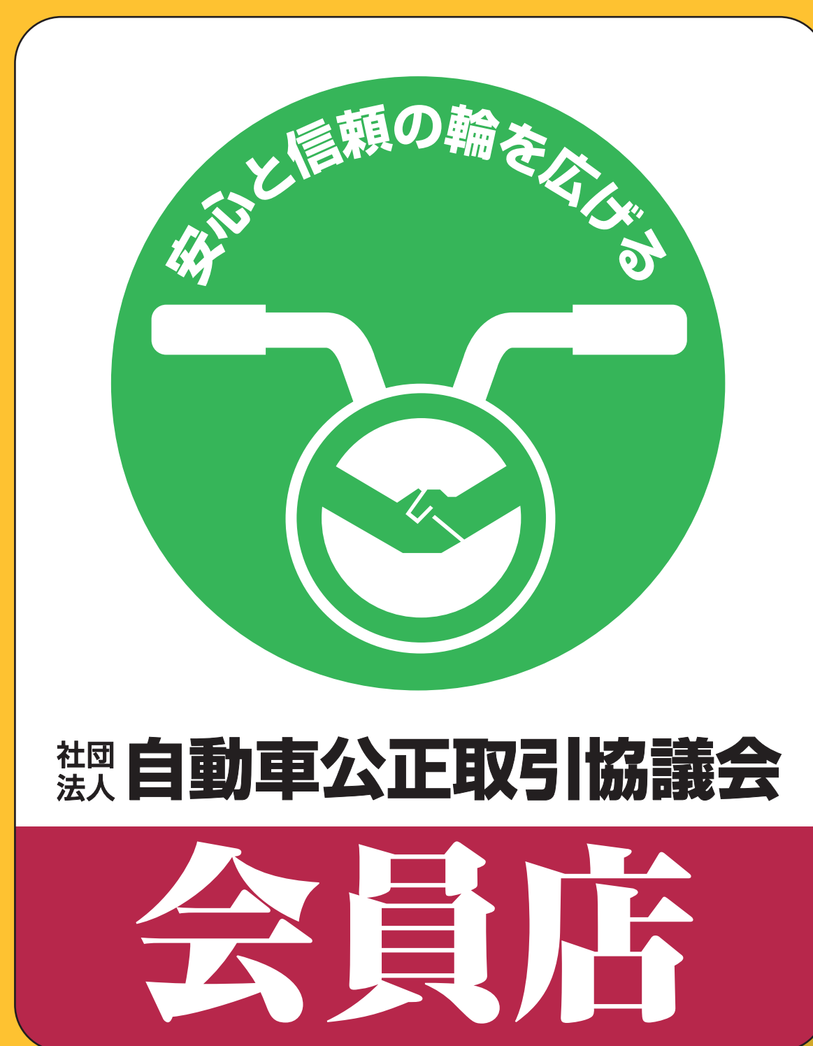
・ステッカー(二輪)