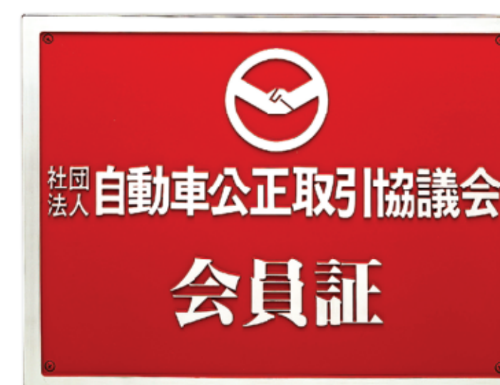
・会員証プレート

社団法人 自動車公正取引協議会は、公正取引委員会から認定された『公正競争規約』の運用を通し、消費者と販売店とを結ぶ『信頼されるクルマ・バイク販売』を推進しています。