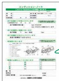
コンディションノートの表示例