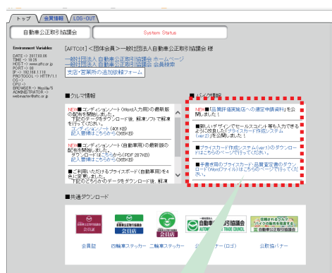
【公取協会員専用ページ】

動画URL (YOUTUBE): https://www.youtube.com/watch?v=__wh482D05k