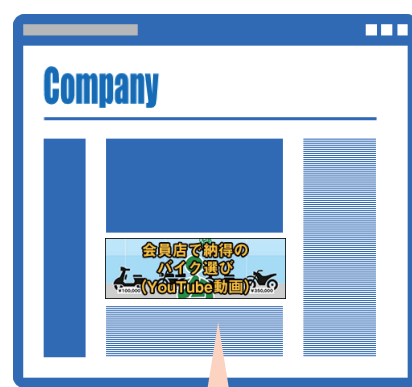
【貴販売店HPイメージ】